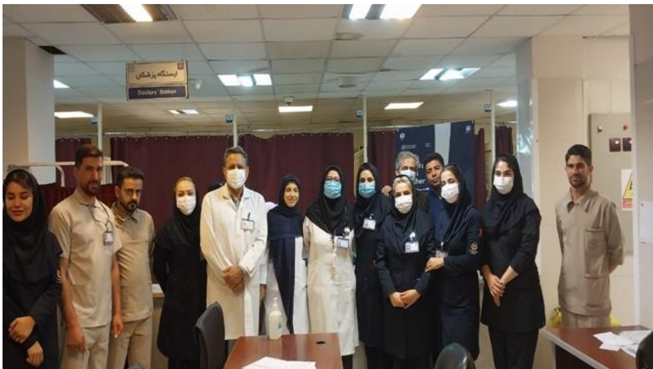
معاونت درمان کمیته کنترل عفونت