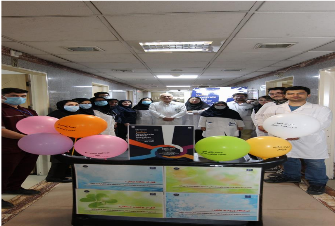
بازدیدهای انجام شده مورخ ۱۴۰۲/۲/۱۰