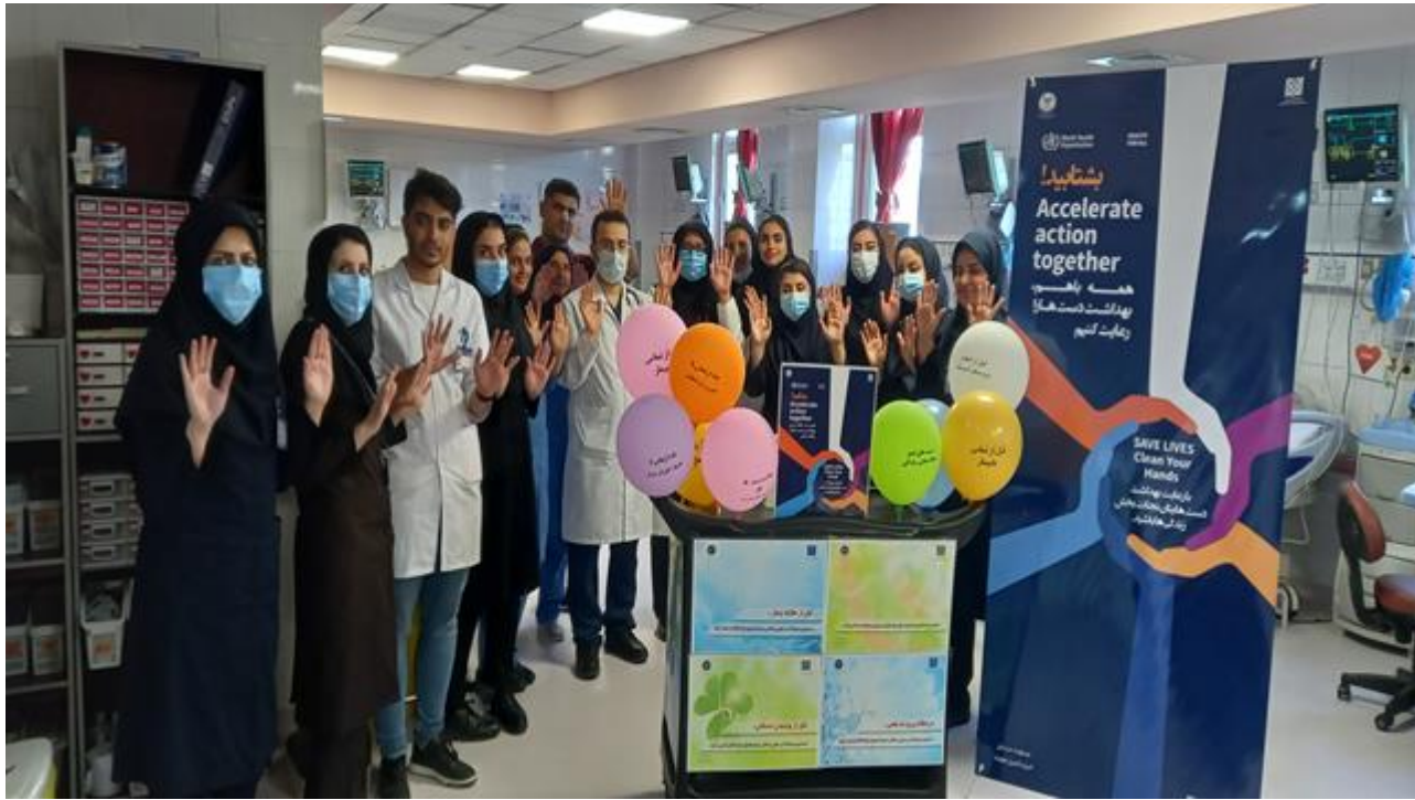
بازدیدهای انجام شده مورخ ۱۴۰۲/۲/۱۱