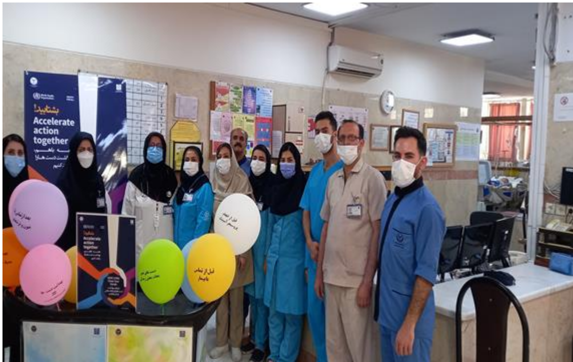
بازدیدهای انجام شده مورخ ۱۴۰۲/۲/۱۶